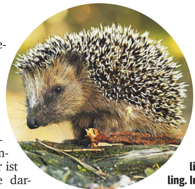
Possierlicher Nützling. In der Dämmerung holt der Igel seine Schneckenmahlzeit